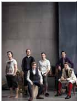
holstunarmusigbigbandclub: 28. April 2017, Sonnenbergsaal Nüziders