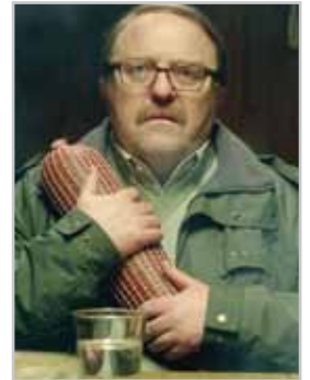
Der Kurzfilm „Herman the German“ ist Teil der ALPINALE Ländle-Tour.

Mit Gaby Moreno präsentiert Bludenz Kultur im Juni 2017 erstmals eine vielbeachtete Musikerin aus Guatemala. Man darf auf die vielfach ausgezeichnete Singer-Songwriterin gespannt sein.