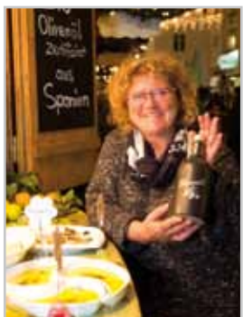
Kulinarik und Kreatives standen im Mittelpunkt.

Donnerstagabends wurde der Christkindlemarkt zum Feierabendtreffpunkt: Unter dem Titel „DJ, Punsch & Glühwein“ sorgten vier Live-DJs für Stimmung in der weihnachtlich geschmückten Mühlgasse.