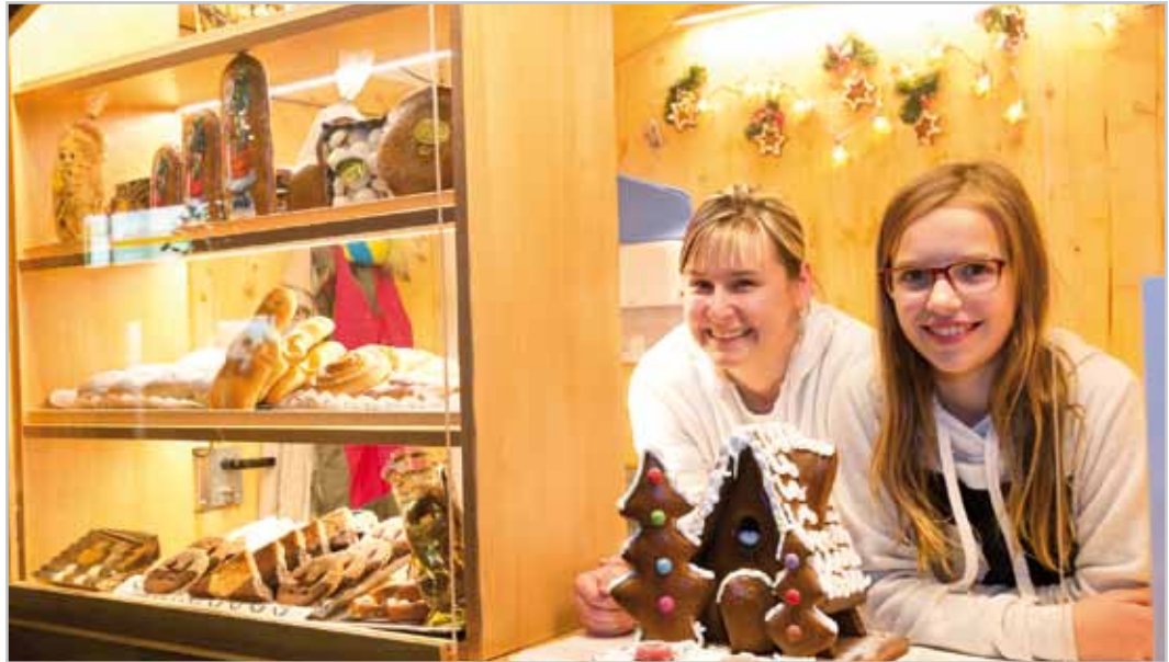
Kulinarische Köstlichkeiten gab es beim Christkindlemarkt in vielen Variationen.

Weitere Informationen: Bludenz Stadtmarketing GmbH Tel. 05552-63621-258, stadtmarketing@bludenz.at www.bludenz.at www.bludenz.travel