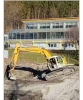
Die Bagger sind im VAL BLU aufgeföhren.