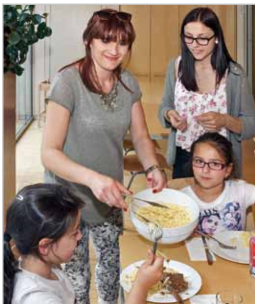
Mittagsbetreuung an den Bludenzner Schulen ist mehr als nur Essensausgabe.

Große Bauvorhaben in Planung - zahlreiche Verbesserungen für 2017