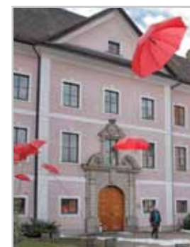
UNIKAT B - 28. bis 30. April 2017