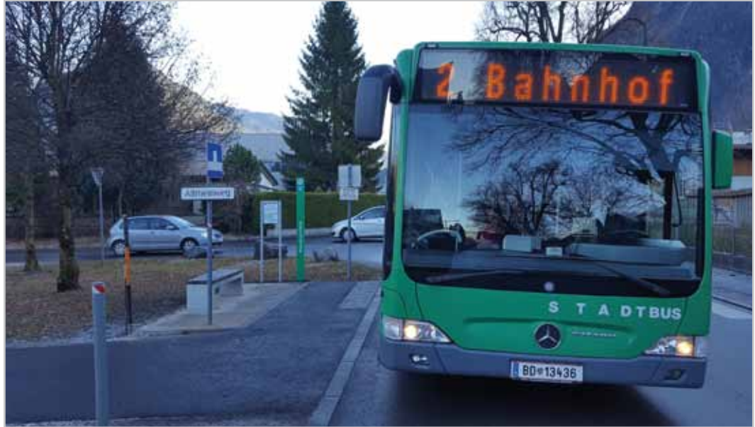
Die neue Haltestelle in der Klarenbrunnstraße.

Mit der Fahrplanumstellung am 11. Dezember 2016 bietet auch der Stadtbus Bludenz ein deutlich erweitertes Programm. Der Halbstundentakt wird ausgebaut und Haltestellen werden verbessert.