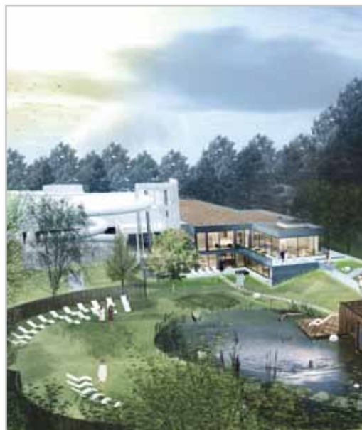
Die Saunaaanlage des VAL BLU wird erweitert. Ein Badeteich mit rund 350 m 2 und ein Außenwärmebecken werden neben der Außensauna neue Highlights.