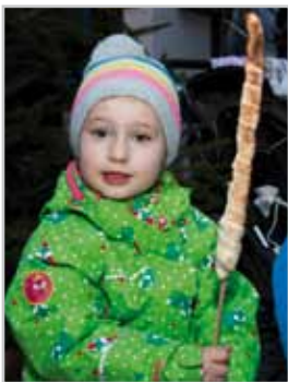
Stockbrot grillen im Höfle.

Der neu gestaltete Bludener Christkindlemarkt ging heuer in die zweite Runde und einmal mehr wurde die Mühlgasse zum stimmungsvollen Treffpunkt im Advent. Rund um Kulinarik und Kreatives wurde ein buntes Programm geboten und zahlreiche Besucher genossen die Atmosphäre.