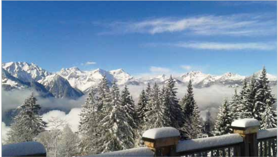
Ein traumhaftes Panorama eröffnet sich dem Besucher auf der Sonnenterrasse.

Informationen und Bilder der Webcam unter: www.muttersberg.at