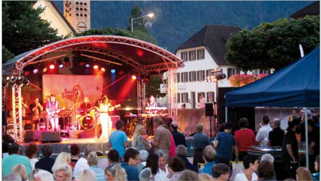
Tolle Stimmung bei der Bludenz Jazz Night auf dem Remiseplatz. Auch 2017 „groovt“ es wieder in der Alpenstadt.