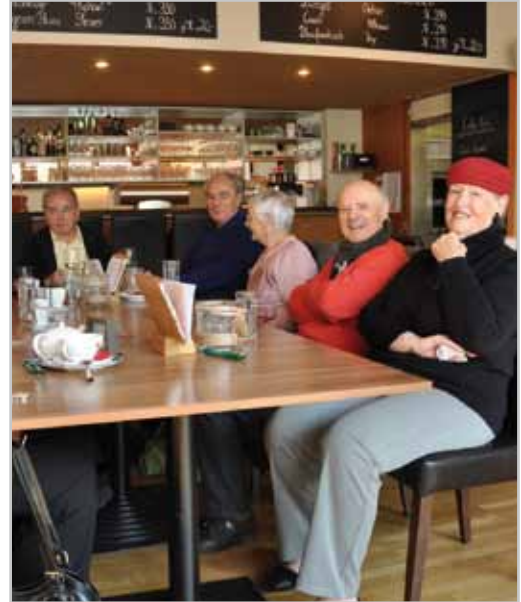
Immer wieder freitags - SeniorInnentreff im Café Remise.

Schon fix sind die Senioren-Kreativtage vom 20. bis 22. Oktober. Dort werden wieder kreative SeniorInnen zeigen, was sie handwerklich, musikalisch oder künstlerisch zu bieten haben.