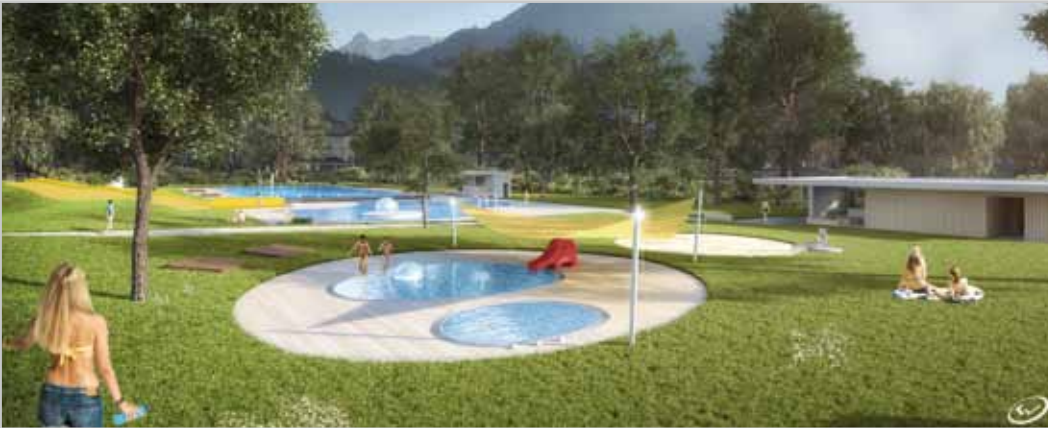
Für Beschattung der neuen Kinderplanschbecken wird gesorgt.

Geplant wurde das neue Schwimmbad und die Saunaaanlagen vom Tiroler Architekt Hagen-Pohl. Die Baumeisterarbeiten wurden ganz regional vergeben. Tomaselli/Gabriel Bau aus Nenzing und Nüziders hat den Zuschlag von der Stadt Bludenz erhalten.