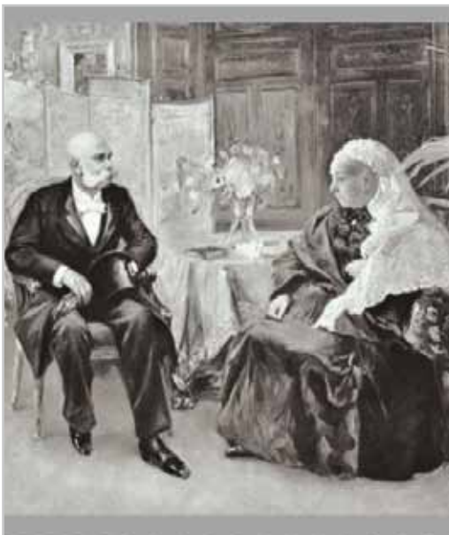
Königin Viktoria von England trifft Kaiser Franz Josef von Österreich.

Ausstellung des Philatelie-Clubs Montfort im Rathaus Bludenz