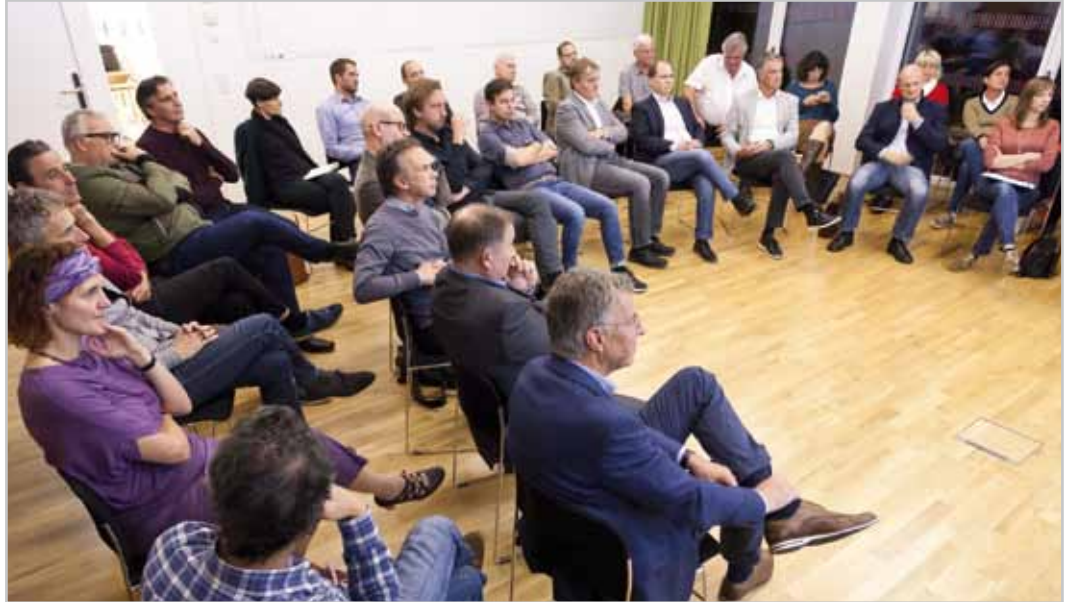
Intensive Workshops waren für die Erstellung des Leitbildes notwendig.

Liebe Bludenerinnen und Bludener, in den letzten Monaten haben wir intensiv für Sie gearbeitet. Zahlreiche Projekte konnten weitergeführt werden.