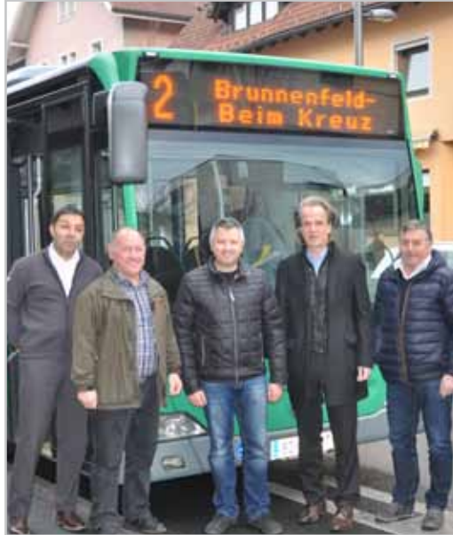
Unser Stadtbusteam - gemeinsam für Mobilität in Bludenz unterwegs.