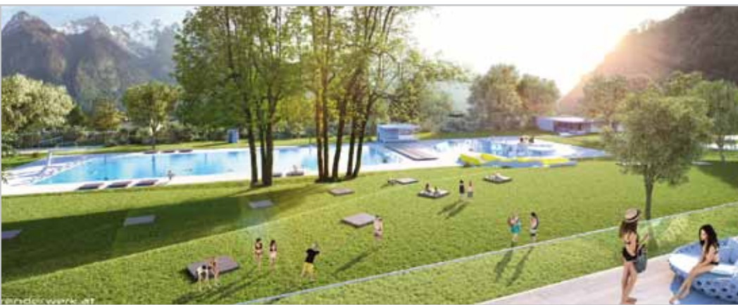
So wird der Blick von der Sonnenterrasse auf die Badeanlage sein. Die Sicht auf die Wasserflächen war für die Planer entscheidend für die Situierung der Becken.